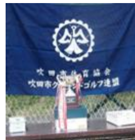
体協杯優勝カップ