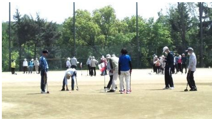
桃山台スポーツグラウンド 4月20日(土)連盟杯前期大会