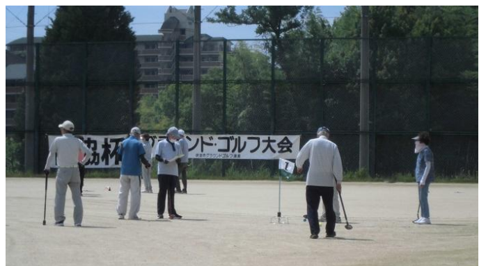
桃山台スポーツグラウンド 6月22日(土)体協杯前期大会