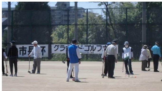
桃山台スポーツグラウンド 5月18日(土)市長杯大会