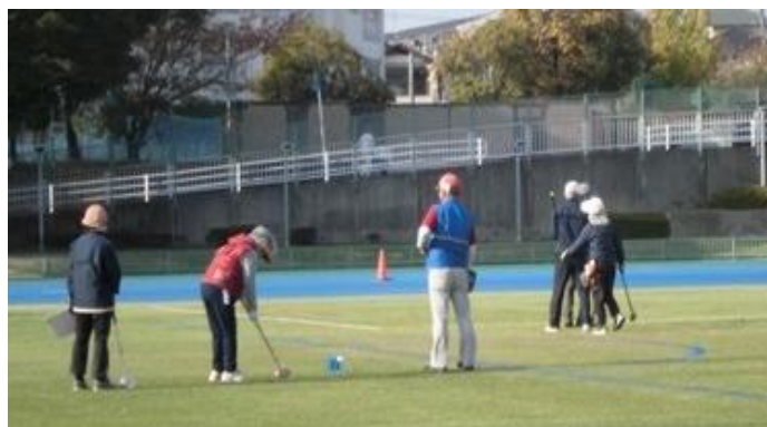
総合運動場 11月22日(金)月例競技会