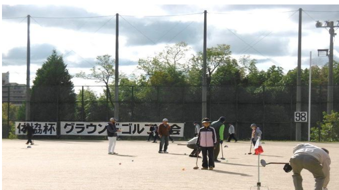
山田スポーツグラウンド 2月25日(火)スクール