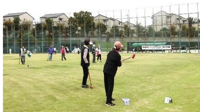
山田スポーツグラウンド 10月26日(土)レディース大会